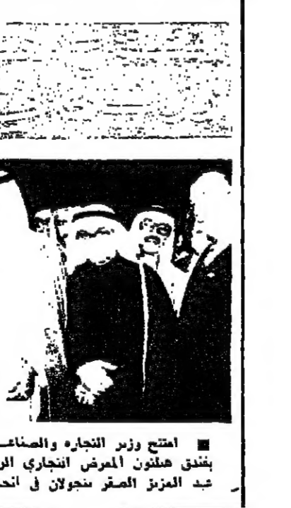
استمع وزير التجارة والصناعة التونسي السيد عبد الوهاب النعيمي بنقده هلتون المعرض التجاري الروماني - وبدو في الصورة والى جانبه عبد العزيز الأسمر سجنال في انحاء المعرض

« ان يواتي المركز الدول العربية بنتائج اجناعت لجنة عمل التصنيع والمجموعات المتخصصة المتبقية عنها اولا باول . « ان يواتي المركز الدول العربية بنتائج اجناعت لجنة عمل التصنيع والمجموعات المتخصصة المتبقية عنها اولا باول . « ان يواتي المركز الدول العربية بنتائج اجناعت لجنة عمل التصنيع والمجموعات المتخصصة المتبقية عنها اولا باول .